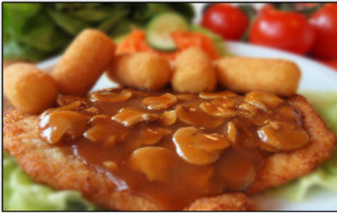
Jägerschnitzel mit Kartoffelkroketten und Beilagensalat